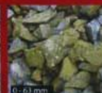
0 - 63 mm