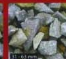
31 - 63 mm