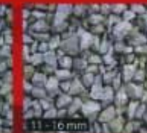
11 - 16 mm