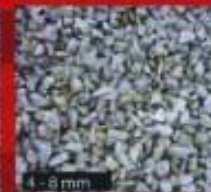
4 - 8 mm