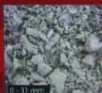
0 - 31 mm