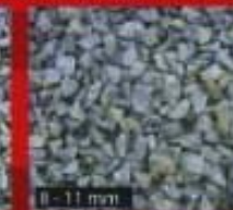
8 - 11 mm