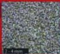
2 - 4 mm