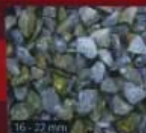
16 - 22 mm