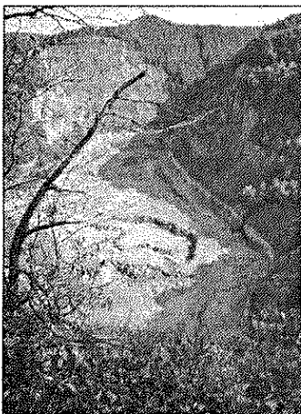
Лединчако језеро сада

Како тврди, "Алас Раковац" је учинио све што је било предвиђено: језеро је испражњено и одржава се сувим, стање у копу је снимљено, и сада је потребно